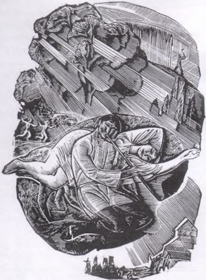
Г. Якутович. Фронтиспіс до повісті М. Коцюбинського «Тіні забутих предків». 1963–1966 рр.

У 1983 році Г.В. Якутовичу було присуджено Національну (тоді Державну) премію України імені Тараса Шевченка за ілюстрування видань: «Повість минулих літ», «Слово про Ігорів похід», «Козак Голота» М. Пригари та збірку «Карби. Чічка. Злодія зловили» М. Черемшини. Другу Шевченківську премію художник одержав у 1991 році у складі творчої групи за вагомий внесок у кінофільм «Тіні забутих предків». Яскрава творчість художника тісно пов'язана з традиціями своєї нації, він розкриває шар її самобутньої культури, шар життя народного і відчуває свою органічність на цьому тлі, невіддільність від рідної землі — України.